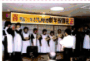
ヘルパーさんのチームワークを生かしての「みかんの花畑く丘」、美しい歌声でした！（新年祝賀会より）